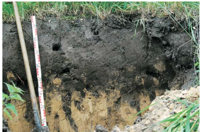
Abb. 1: Das Schwarzerde-Profil von Asel